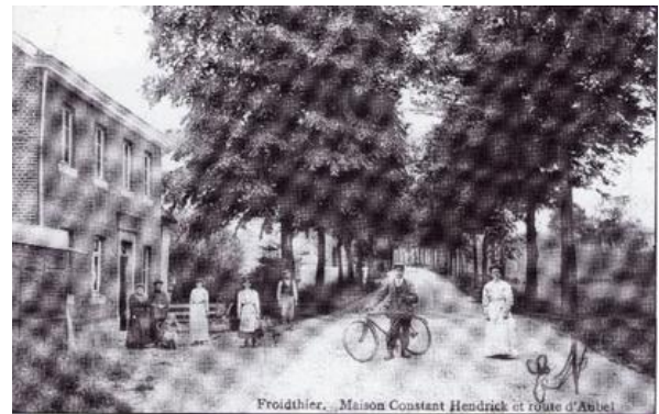
La route d'Aubel il y a 1 siècle