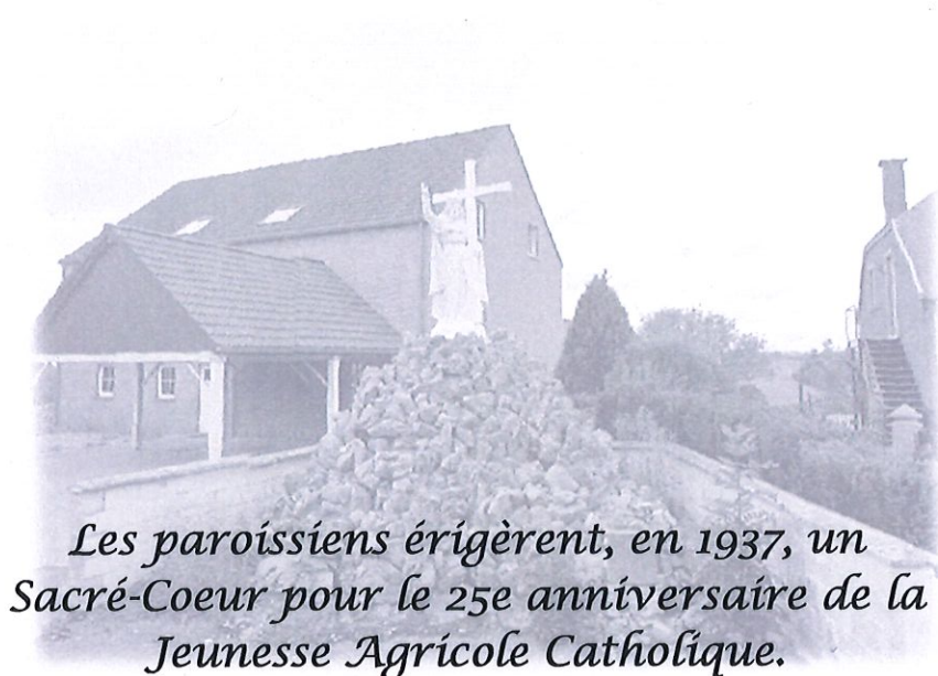
Les paroissiens érigèrent, en 1937, un Sacré-Coeur pour le 25e anniversaire de la Jeunesse Agricole Catholique.

Dos à l'église, dirigez-vous vers la gauche jusqu'au carrefour. À ce carrefour, en empruntant Cour Palant, continuez tout droit jusqu'au prochain carrefour, 350m plus loin. Traversez la N648 avec prudence pour continuer tout droit sur les Trixhes. Après 100m, délaissiez la rue sur votre droite pour continuer tout droit pendant 500m jusqu'à un Y, où vous prendrez la branche de gauche. Observez sur votre chemin le patrimoine religieux 22 .