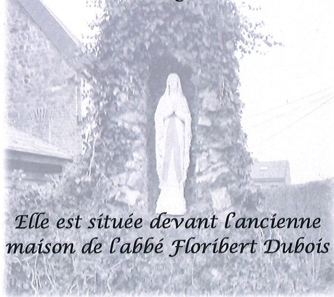
Elle est située devant l'ancienne maison de l'abbé Floribert Dubois

Après avoir observé la croix à l'Y, descendez tout droit sur votre gauche.