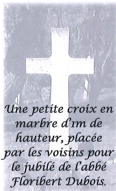
Une petite croix en marbre d'1m de hauteur, placée par les voisins pour le jubilé de l'abbé Floribert Dubois.